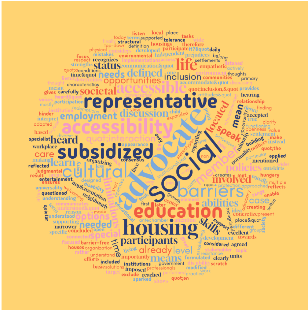
Εικόνα 1: Τι σημαίνει για εσάς ενταξιακή κοινότητα χωρίς αποκλεισμούς;

Λέξεις κλειδιά: συνήγορος, ευκαιρίες, επιλογές, κοινωνικές, αντιπροσωπευτικές, προσβασιμότητα, συμμετοχή, πολιτισμός, απασχόληση, ικανότητες, ψυχαγωγία, εκπαίδευση